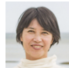
野口 里佳 写真家