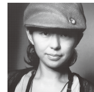
野村 佐紀子 写真家