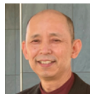
高橋 秀治 豊田市美術館 館長