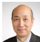
島谷 弘幸 皇居三の丸尚蔵館 館長