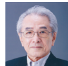
森口 邦彦 染織家、 重要無形文化財 「友禅」保持者